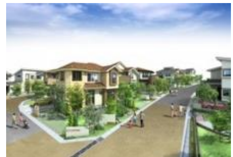
我孫子 PRIME TENNODAI -我孫子プライム天王台-

JR 常磐線 天王台駅より徒歩 20 分、JR 成田線 東我孫子駅より徒歩 19 分。全邸 165 平米以上の敷地面積。魅力あふれる我孫子の高台に生まれる、自分好みのスタイルを味わう全 20 邸の美しい街。