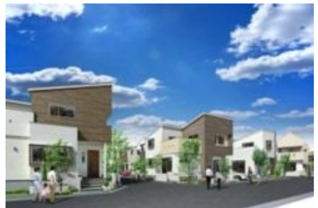
柏 L.L.C<<柏ロングライフカーサ>>

JR 常磐線・東武アーバンパークライン（東武野田線）柏駅より徒歩 24 分。5 つの「デザイン」から生まれるポラス初のウエルネスタウン「柏ロングライフカーサ」誕生！