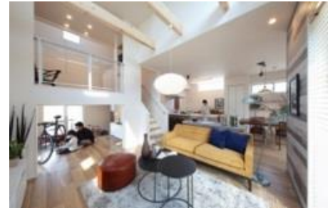
Mirais 三郷中央 nextstage

つくばエクスプレス 三郷中央駅より徒歩 9 分。さらなる成長を続ける三郷中央エリアにポラスが描く未来図プロジェクト。