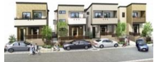
リーズン津田沼デライト・スタイル

新京成電鉄・京成本線 京成津田沼駅より徒歩 12 分、JR 中央・総武線・JR 総武線 津田沼駅より徒歩 13 分、新京成電鉄 新津田沼駅より徒歩 10 分。3 駅利用可！様々なシーンを演出する LED ダウンライト全棟標準仕様。高品質なすまい×あかりで、豊かな私的空間を演出。