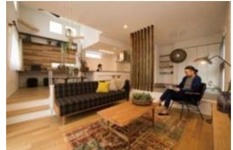
ラズ・ダ・ラム 蒲生

JR 武蔵野線 南越谷駅より徒歩 20 分、東武スカイツリーライン 蒲生駅より徒歩 8 分。2 路線 2 駅利用可能な好立地に「ゆとり」をテーマにした街が誕生。