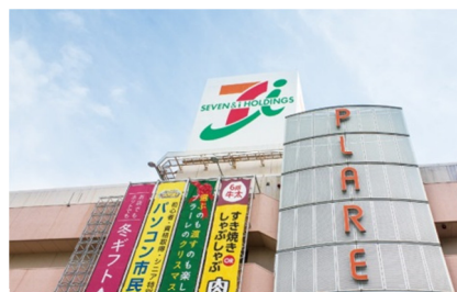
イトーヨーカドー