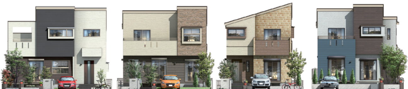
01 BOARDER 【ボーダー】