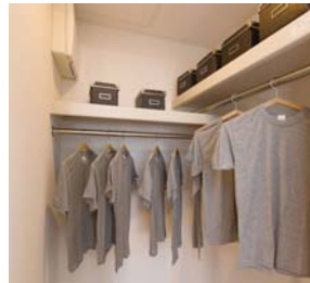
ウォークインクローゼット お洒落好きの家族の衣類もしっかりしまることができます。