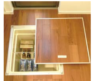
床下収納 ストックしておきたい物の収納に便利なスペースです。