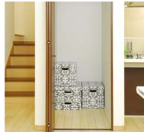
ホール収納 掃除道具などかさばるものもきっちりしまえます。