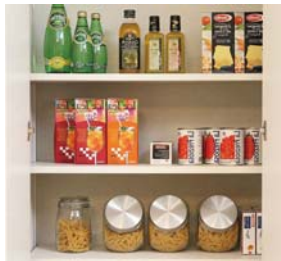
パントリー キッチン脇の食品庫、食材のストックなど、もしもの時にも助かります。