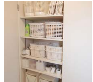
リネン庫 洗面所にありタオルや洗剤をスッキリと収納できます。