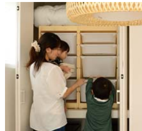
和室収納 座布団などをしまえ、来客の際に重宝する収納です。