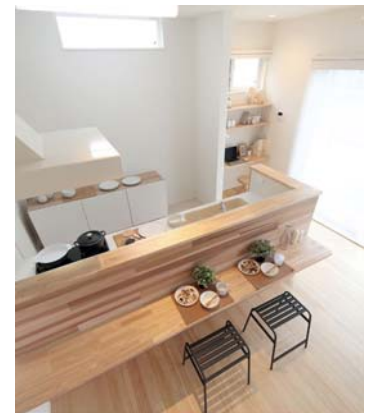
6. カフェカウンター