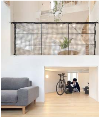
1. ゆとりを育むスキップフロア