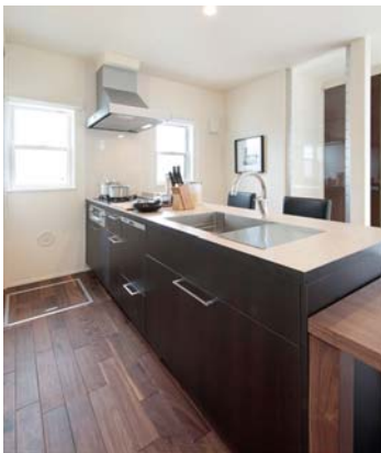
4. フルフラットキッチン