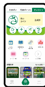
※画面はイメージです。