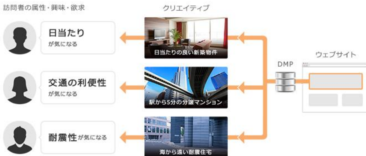
-ユーザーインサイトセグメントに基づいた LPO 施策イメージ（例：不動産物件サイト）-

これにより、業種毎のユーザーインサイトに応えるマーケティングメッセージをセグメント別に最適化でき、ターゲティング効果が劇的に向上します。