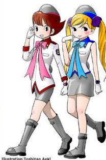
Illustration: Toshinao Aoki ©(K&I)YODO,Mizutama Keichojo,Toshinao Aoki 2021 ©2021 Wonder Festival Project Office All Rights Reserved.