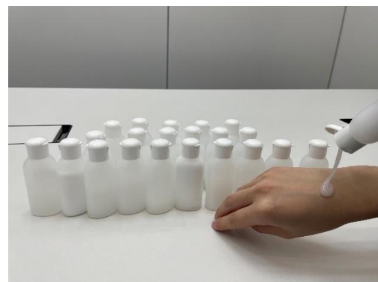
▲検証に活用したサンプル品の数々

発売後には、「サラッとしていてベタつかないのでとても塗りやすい」といったSNSでの反応も寄せられており、ボディ&ニオイケアの両立にこだわり抜いた点に好評いただいています。