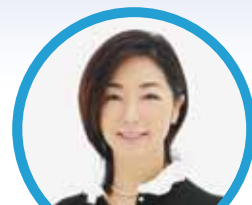
司会 中井 美穂 フリーアナウンサー

場所： 東京医科歯科大学 M&D タワー 2F 鈴木章夫記念講堂 (〒113-8510 東京都文京区湯島 1-5-45)