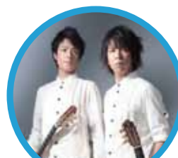
いちむじん クラシックギターデュオ

「龍馬伝」のテーマ曲を演奏した「いちむじん」のスペシャルコンサートも開催します。