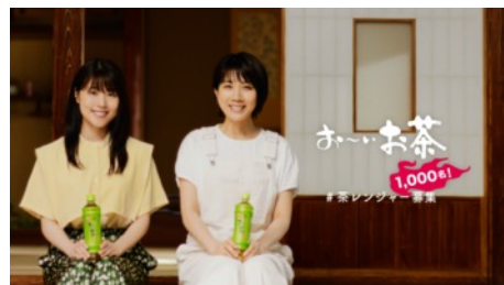
茶レンジャー募集