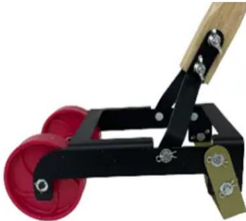
② 刃が約 20°傾斜