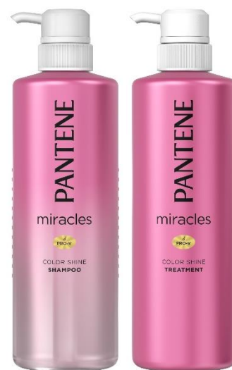
パンテーン ミラクルズ カラーシャイン シャンプー&トリートメント 容量：480mL/480g 価格：全てオープン価格