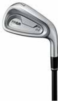
PRGR 04 IRON

「PRGR 0 WEDGE」のバックフェースには、「PRGR 04 IRON」同様、「Oval Cavity Design」を採用。安心感をもたらすやや大きめのヘッドサイズ、イージー・ワイドV(ブイ)ソールと相まってゴルファーをプレッシャーから解放するやさしさを詰め込みました。また、ロフト毎にソール幅、V字角を最適化し、48°/50°ではフルショット時のソールの抜けを重視、52°/54°ではフルショットとショートゲームでの抜けを両立、56°/58°ではワイドソールでバンス効果の最大化を図るなどあらゆるシチュエーションでの抜けの良さを実現しています。さらにフェース面には「縦マイクロミーリング処理」を施すことで、雨やラフといったイレギュラーな場面でも安定したスピン性能を発揮します。