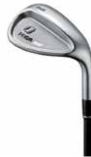
PRGR 0 WEDGE