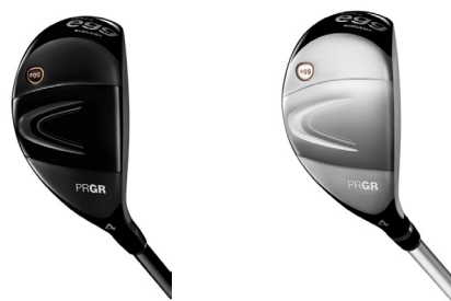
SUPER egg evolution ユーティリティ (左からメンズとレディス)