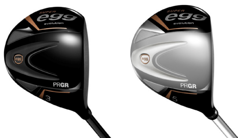
SUPER egg evolution フェアウェイウッド (左からメンズとレディス)