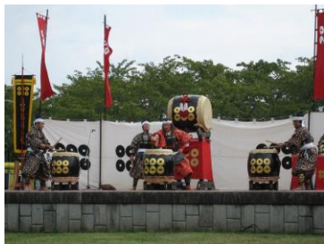
信州芸能まつりでの 真田勝鬨太鼓(イメージ)

「善光寺御開帳と信州芸能まつりの旅2日間」は、御仏とのご縁が生まれる「善光寺御開帳」とともにクラブツーリズム特別企画「信州芸能まつり」をお楽しみいただける、首都圏各地(東京、神奈川、埼玉、千葉、茨城)17箇所から出発する1泊2日のバスツアーです。