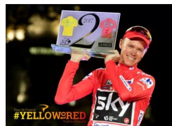
クリス・フルーム

2017年、“ツール・ド・フランス”4回目の総合優勝、さらにスペインの“ブエルタ・ア・エスパーニャ”を制し、イギリス人初のダブルツールを達成したクリス・フルーム。現役最強の呼び声も高い名選手が、“ツール・ド・フランス”&“ブエルタ・ア・エスパーニャ”で実際に使用したスペシャルカラーのピナレロ ドグマF10と共に『サイクルモード インターナショナル2017』に登場！ その最高の走りを支えているイタリアの名門ブランド「ピナレロ」を率いるファウスト・ピナレロ社長も迎え、世界最高峰のロードレースの魅力に迫ります！