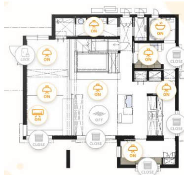
プラットフォームハウスアプリ画面

スマートフォンでコントロールできるスマート家電は世の中に多く存在しますが、そのログは間取りや家族構成などとの関連性のない、単純な「操作ログ」となっています。一方、「PLATFORM HOUSE touch」では、間取りや家族構成などと紐づいた「生活ログ」としてデータが蓄積されます。