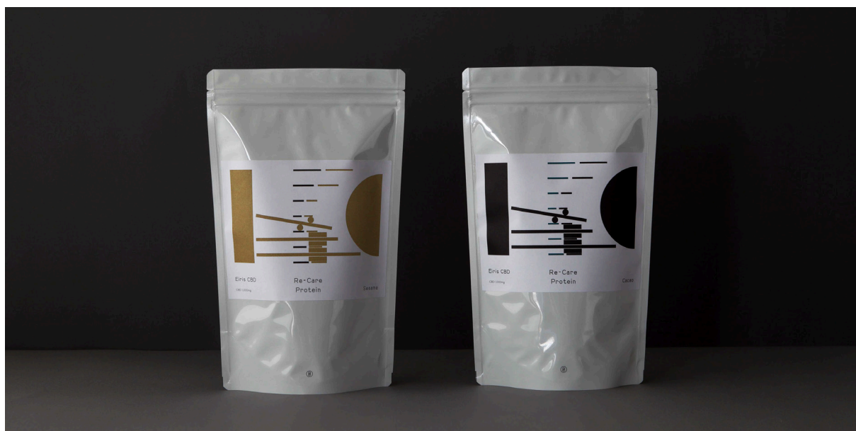
Eiris CBD 商品名:エイリス ケア プロテイン、容量:500g、味:セサミ/カカオ風味、定価:¥8,640(税込)