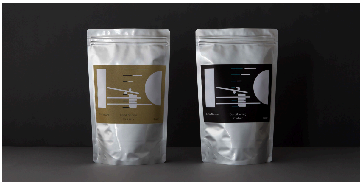
Eiris Nature 商品名:エイリス コンディショニング プロテイン、容量:500g、味:セサミ/カカオ風味、定価:¥6,480(税込)