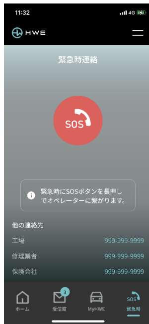
緊急時の連作先を事前登録でき、もしもの時でもスムーズにアクセスが可能