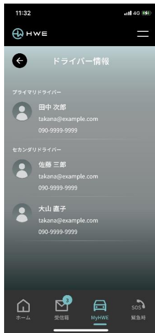
プライマリとセカンダリーそれぞれの機能設定が可能に