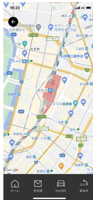
マップと連携することで、車両の現在位置が表示可能