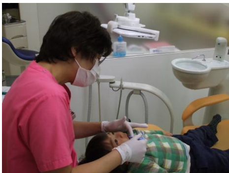
利用例 3 (クリニック: 桜堤あみの歯科)