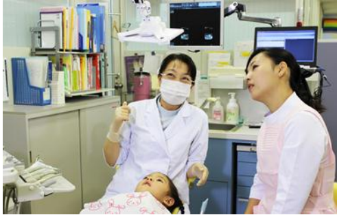
利用例 1 (病院: 東京歯科大学 水道橋病院)

本製品の開発段階において、当端末の有効性について10の病院・クリニックで検証しました。 以下は、実際の歯科診療の現場で使われた主な利用例となります。