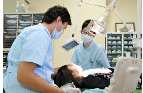
利用例 2 (病院: 明海大学付属明海大学病院)