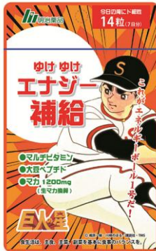
(C) 梶原一騎・川崎のぼる／講談社・TMS