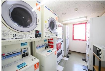
コインランドリー