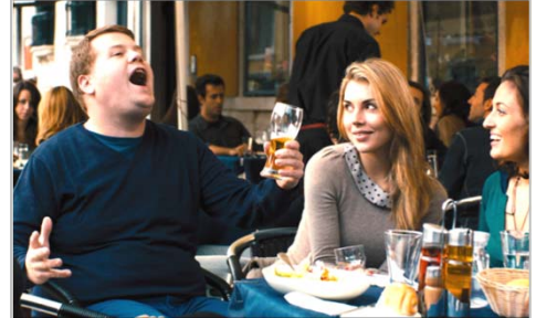
© 2013 ONE CHANCE, LLC. All Rights Reserved.

オペラ歌手になるという夢を諦めず、オーディション番組へ出場したポール・ポッツの行動力から、「前に踏み出す力」を。