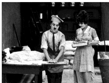
『チャップリンとパン屋』

第3弾目となる今回は、『成功争い』や『チャップリンとパン屋』など、サイレント映画の代名詞であるチャップリン作品に、江原正士、大塚芳忠、高木渉、堀内賢雄、森川智之(50音順)の5人の豪華声優が、“元々存在しない”チャップリンの声のオリジナル吹替に挑戦いたします。