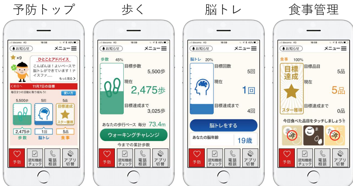
【図 1. 「健康第一」認知症予防アプリ-予防】