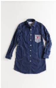
チェックシャツ ネイビー ¥13,860(税込) フリーサイズ (ウィメンズ)