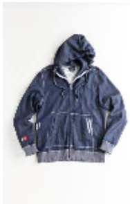
スウェットパーカ ¥16,800(税込) XS・M・L (ユニセックス)