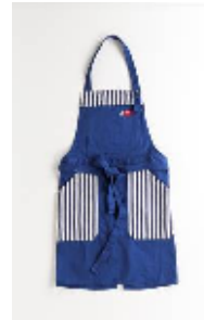
ワークエプロン ¥7,980(税込) フリーサイズ (ユニセックス)