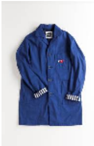
ショップコート ¥23,940(税込) XS・M・L (ユニセックス)

ワークウェアは、日常着の定番として、メンズ・ウィメンズに共通して定着しているファッションジャンルです。 繰り返し着て洗ううちに良さが出る素材と作りで、ロイヤルブルーとネイビーを基調に、オーセンティックなワークウェアに由来するヒッコリーストライプをアクセントに使用しました。様々なスタイリングでお楽しみください。