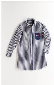
チェックシャツ ストライプ ¥13,860(税込) フリーサイズ (ウィメンズ)