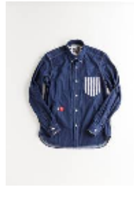
ボタンダウンシャツ ¥11,550(税込) XS・M・L (ユニセックス)