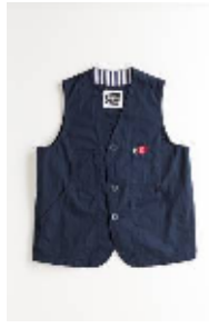
ワークベスト ¥14,700(税込) XS・M・L (ユニセックス)