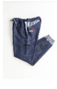
スウェットパンツ ¥16,800(税込) XS・M・L (ユニセックス)