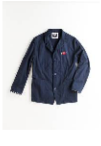
カバーオール ¥21,840(税込) XS・M・L (ユニセックス)