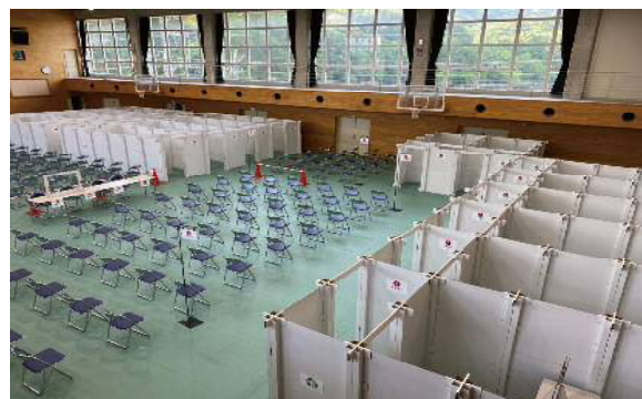
学校法人聖心学園様のご協力により、同校アリーナを提供いただきデモンストレーションを行いました。

提携する企業との連携により、ワクチン接種会場設営運用において多種多様なサービスを展開・提供しています。医療品、介護用品をEC展開されているアズワン株式会社からの消毒液・サージカルマスク・医療用手袋といった備品調達。不要となった紙製パーティションを再生資源として回収いただく合同衛生株式会社など、入口から出口までトータルにサポートできる体制を整えています。