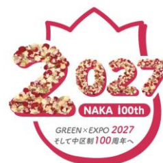
中区ロスフラワープロジェクト