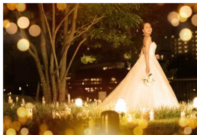
フォトウェディングプラン