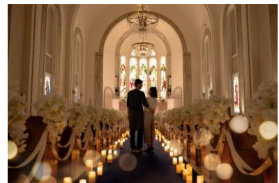
バウリリニューアルプラン