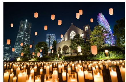
キャンドルナイト

リニューアルオープンを記念し、約500個のLEDキャンドルの光に包まれる幻想的な「キャンドルナイト」を、リニューアルオープン当日の9月14日(土) 19:00から実施します(雨天中止)。10月以降も継続的に開催することで、ロマンティックなみなとみらいの街にふさわしい新たな定番スポットを目指してまいります。