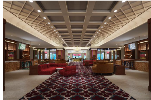
メインエントランス

2チャペル・7バンケットを有する日本最大級のゲストハウスにふさわしいメインエントランスは、開港の街・横浜を象徴するように様々な要素をミックスしました。横浜らしさを意識した洋館の佇まいや、歴史を感じさせる豪華客船の丸窓ミラーなどに加えて、遊び心のあるビビッドカラーの装飾や座り心地の良いソファやシーティングを配置。輪が繋がった柄の絨毯は、「Link Ring」という施設コンセプトの通り、人・企業・街との出会いの連鎖が紡ぐ幸せの循環を表現しました。