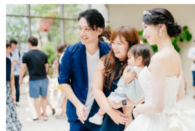
アニヴェルセル大開放祭