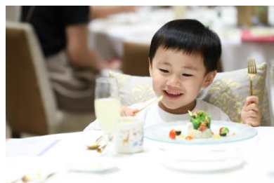
はじめてのフレンチ

これまで街に新たな賑わいを創出する取り組みとして、お子様が主役のフレンチ体験イベント「はじめてのフレンチ」や、アニヴェルセルが制定した記念日である11月23日“いい夫妻の日”のイベント、2年連続で1,000名以上が来場した「アニヴェルセル大開放祭」などを実施してきました。日常的に訪れることのない結婚式場のラグジュアリーな施設や、ウェディングで培ってきた商品・サービスを活かしたイベントを年4回程度開催し、みなとみらい21地区を訪れるきっかけとなり、街での時間を楽しんでいただけるよう取り組んでまいります。