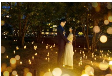
プロポーズプラン

https://www.anniversaire.co.jp/wedding/minatomirai/special/candlelight/