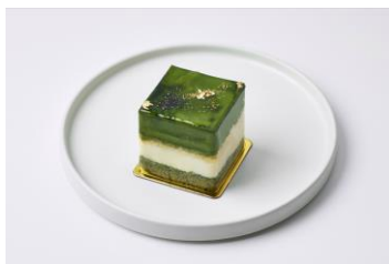
抹茶フロマージュ