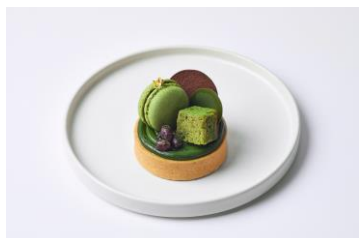
抹茶と黒糖のタルト