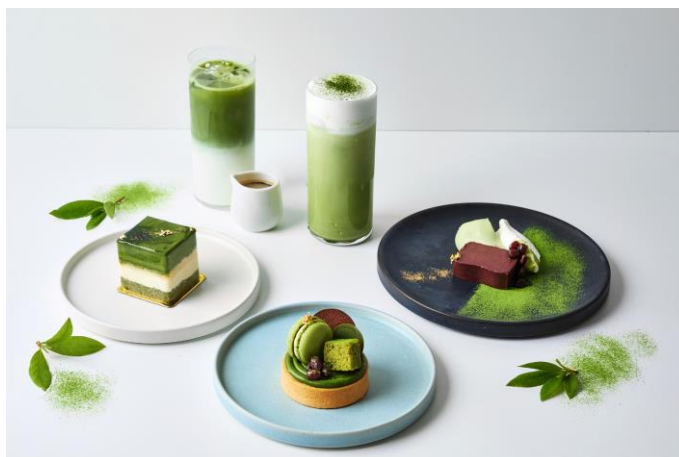
「アニヴェルセルカフェ 表参道」 https://cafe.anniversaire.co.jp/omotesando/

ゲストハウスウェディングを中心に、様々な記念日プロデュース事業を展開するアニヴェルセル株式会社は、「アニヴェルセルカフェ 表参道」にて、2024年5月9日(木)から6月30日(日)までの期間限定で「抹茶Fair」を開催いたします。当フェアでは、色鮮やかで香り豊かな抹茶をふんだんに使用したアフタヌーンティー、スイーツ4種、ドリンク2種の新商品を展開いたします。