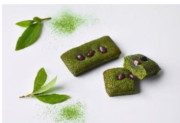
抹茶のフィナンシェ