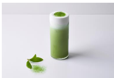
抹茶ロイヤルミルクティー

濃いめに点てた香りの高い抹茶のラテに、深い味わいの黒蜜エスプレッソをお好みで注いで、味の変化をお楽しみいただけます。