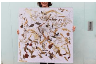
廃棄処分予定の花材を練り込んだ 繊維リサイクルボード

また、ウェディングやパーティ撮影などの短い期間で役目を終えた廃棄予定の花々を毎週月曜日にアップサイクル。「reBorn bouquet (リボンブーケ)」として販売いたします。ラッピングに使用するリボンは、ペットボトルから100%再生されたサステナブルリボンを使用いたします。