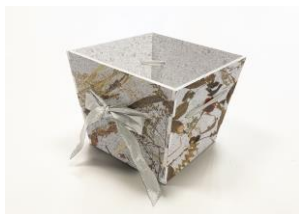
繊維リサイクルボードを使用した フラワーベース