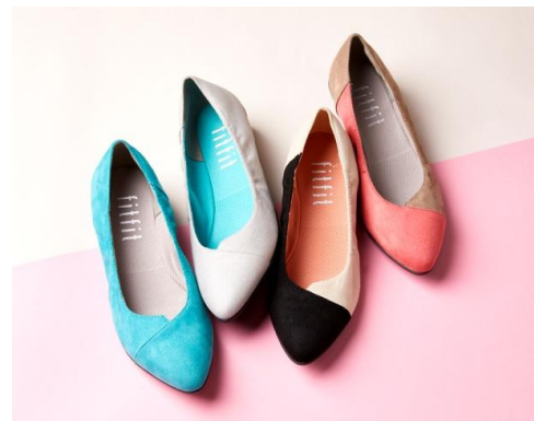
▲フラットパンプスニーカー

近年のスニーカーブームの中でも、fitfit が作りだすスニーカーは“エレガントなのに歩きやすく、様々なシーンで使いやすい”という声を多く受けており、年間10万足のスニーカーを販売するなどいくつものヒット商品を生み出してきました。今回発売する『バレエスニーカー』は、アッパー部分は優美なバレエシューズに、アウトソールはアクティブなスニーカー仕様になっており、女性らしさを演出するエレガントさと歩きやすさを兼ね備えたスニーカーです。また、fitfit が医療機関のアドバイスに基づいて新しく開発したインソール「フィットフォルム」が搭載されているため、土踏まずと指の付け根のアーチをしっかりとサポートし快適な歩行を実現いたします。