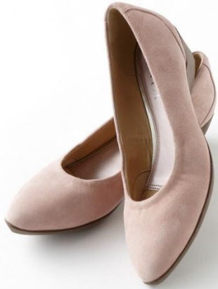
ポイントッドパンプニーカー(¥12,900+税)

2016年8月より発売している定番商品に春らしい新色が登場。シンプルなデザインのため、テイストを選ばずいろいろなコーディネートに対応できます。