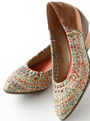
メッシュパンプニーカー(¥13,900+税)

素足にはいて、パンプスのようにはけるパンプス。春先から、盛夏までながく愛用いただけます。