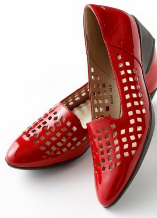
カットワークパンプニーカー(¥12,900+税)

今までのコーディネートに投入するだけで、旬な顔になる等身大のおしゃれがたのしめるパンプス。