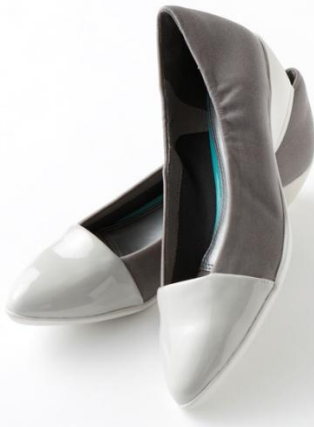
撥水バイカラーパンプニーカー(¥11,900+税)

エナメルトゥのツヤ感が大人の上品さを醸し出すパンプス。レイン対応のため急な雨でも安心です。