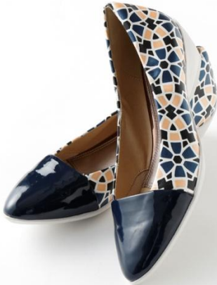
エナメルポイントッドトゥパンプニーカー(¥12,900+税)

いろいろなコーディネートにエレガントさをプラスできるさり気ないベーシックデザインのパンプス。