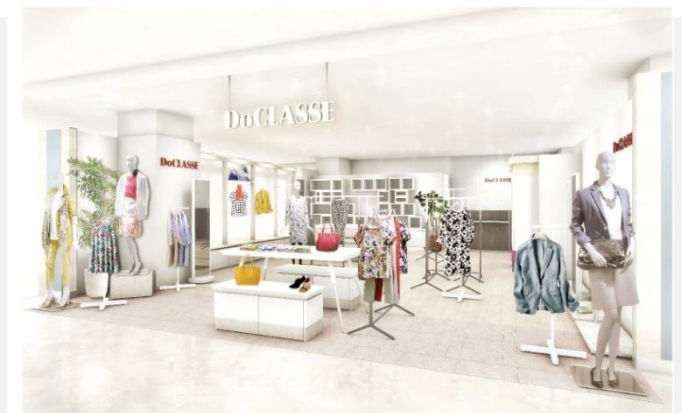
DoCLASSE神戸三宮さんちか店 イメージ