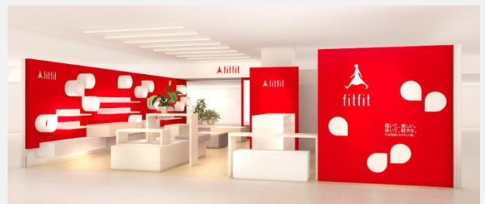
fitfit神戸三宮さんちか店 イメージ