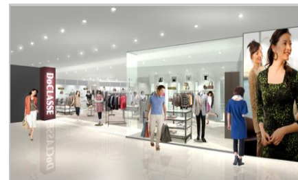
※「DoCLASSE仙台店」イメージパース

DoCLASSEの直営店舗はこれまで東京（自由が丘、二子玉川、日比谷、立川）、神奈川、埼玉、千葉、愛知、大阪、兵庫、福岡などに展開し、「DoCLASSE仙台店」は全国で11店舗目の出店になります。