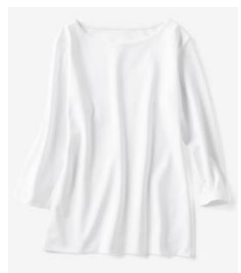
▲ポートネック(7分袖/着丈58cm)

幅広いシーンに合わせて選べる、1枚で“綺麗”が叶う『ドウクラッセTシャツ』を身につけ、毎日のオシャレをお楽しみください。