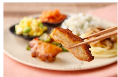
ウーディッシュ ® 鶏肉の味噌だれと和風きのこパスタ