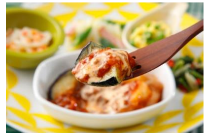
気くばり御膳 ® なすとポテトのミートソースセット