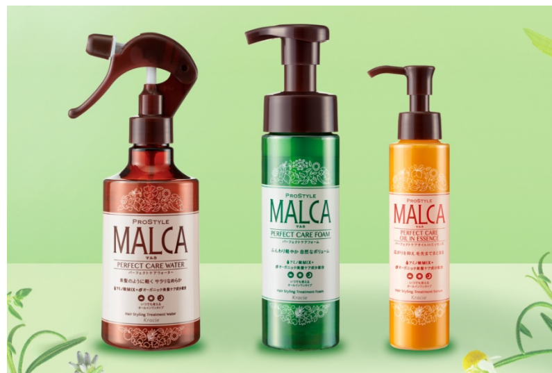
左からウォーター、フォーム、エッセンス