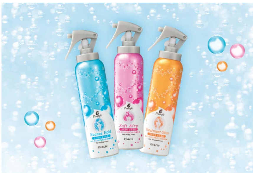
左から ニュアンスホールド/ソフトエアリー/トリートメントグロス

「プロスタイル スパークリングクリーミーホイップ」は、炭酸の力でキューティクルを引き締め、ダメージをケアしながら、思い通りのヘアアレンジを簡単にかなえる「炭酸泡」スタイリングシリーズです。「髪のまとまり」を処方ベースにしながら「しっかり」「ふんわり」「ツヤ」という仕上がりにニーズに対応した3種を発売します。