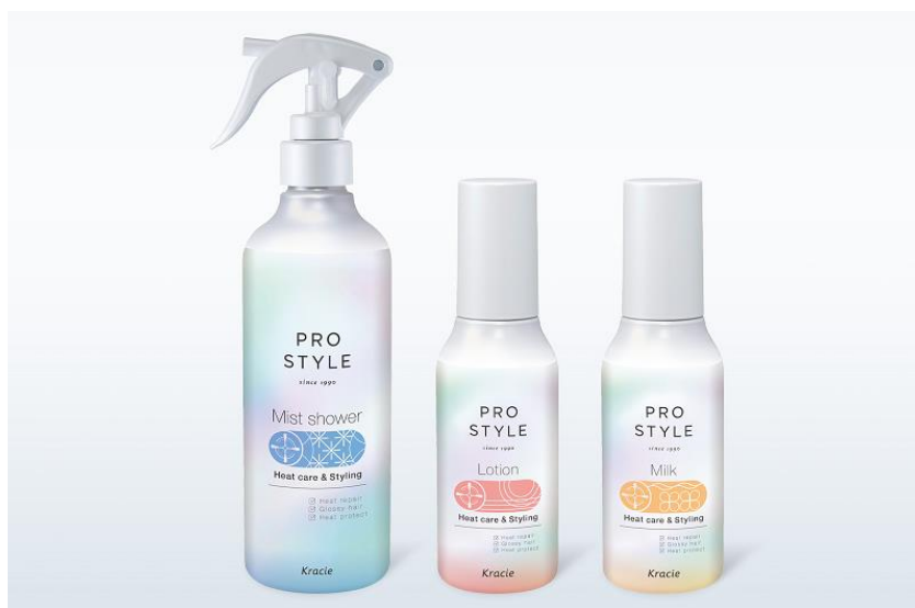
<左から:ミストシャワー、ローション、ミルク>