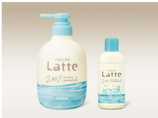
<写真左:通常サイズ(490mL)、写真右:「マー&ミー リンスインシャンプー ミニ」>

今回発売する「リンスインシャンプー ミニ」はマー&ミー リンスインシャンプーのご愛用者さまから寄せられていた、「持ち運びができるようなトラベルサイズが欲しい」というご要望を実現。シャンプー、リンス、洗顔、ボディソープをこれ1本で完了でき、且つ、大人と子どもが一緒に使える、家族旅行にぴったりなトラベルサイズをぜひお試しください。