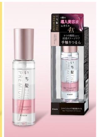
4Xシャインシェイク美容液オイル