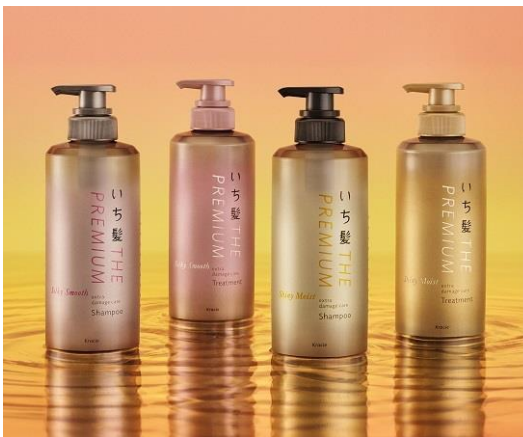
シャンプー&トリートメント (シルキースムース/シャイニーモイスト)