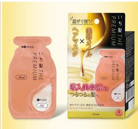
Wケアブースター美容オイルマスク