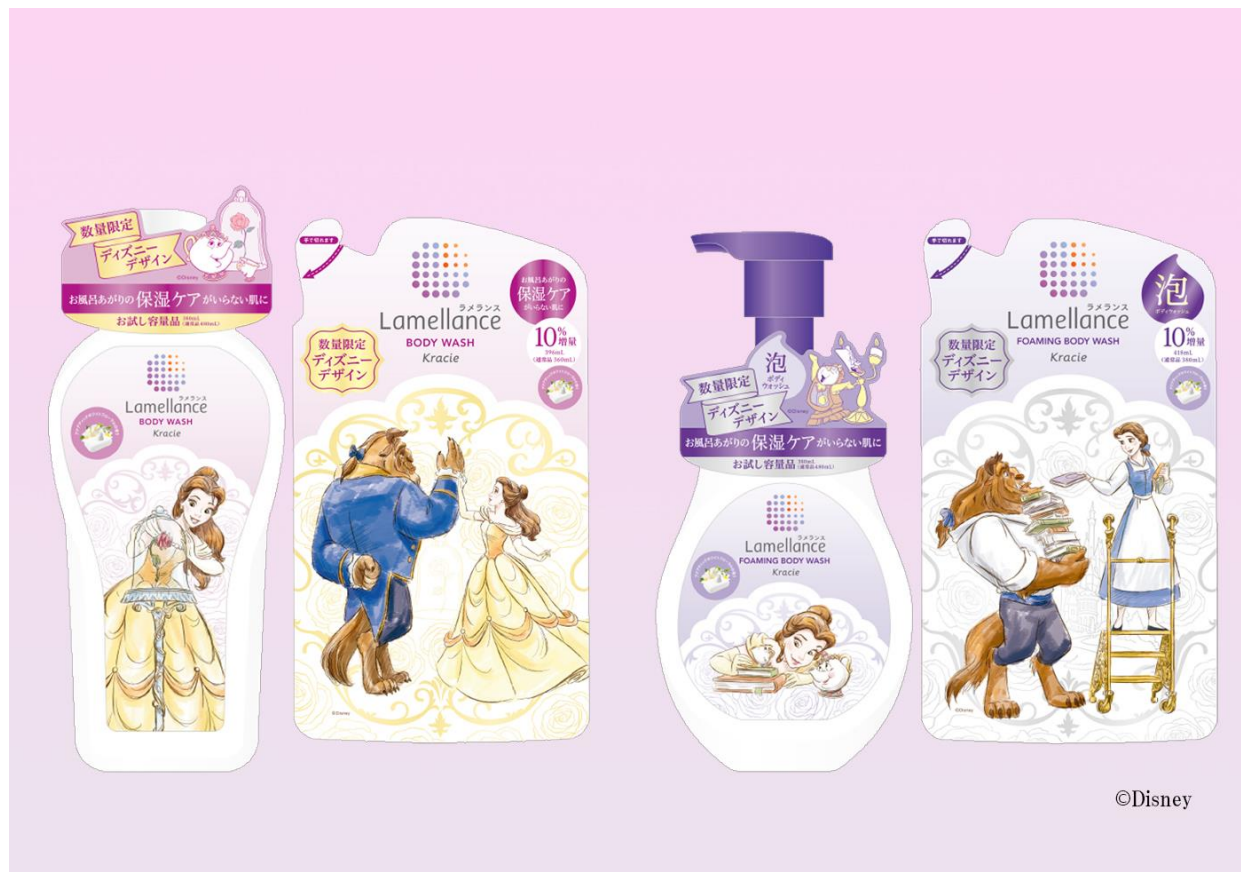
左からラメランス ボディウォッシュアクアティックホワイトフローラル(ポンプ・詰替用)、泡ボディウォッシュアクアティックホワイトフローラル(ポンプ・詰替用)

クラシエホームプロダクツは、「Lamellance(ラメランス)」ボディウォッシュシリーズから、『美女と野獣』限定デザインを、2020年10月5日(月)に数量限定で発売いたします。