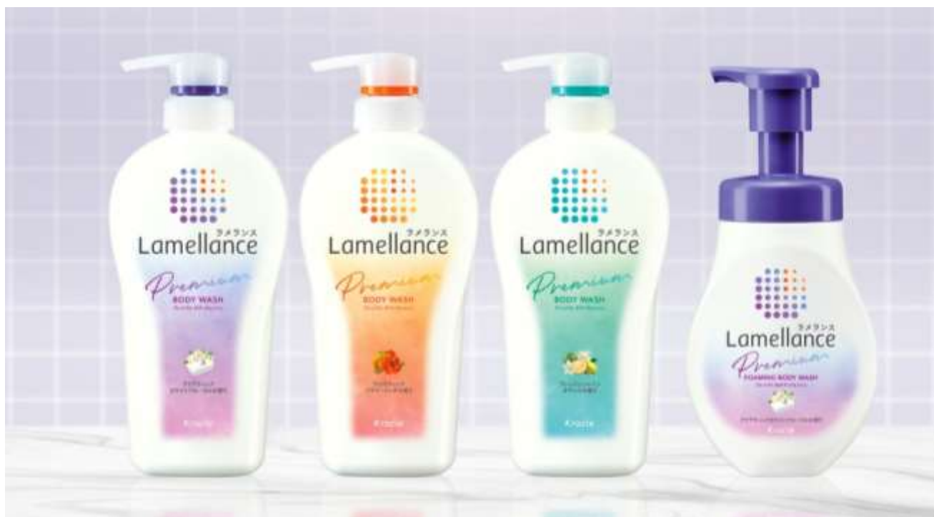
左から、ボディウォッシュアクアティックホワイトフローラル、同アロマティックフラワーリッチ、同さらっとタイプ、泡ボディウォッシュアクアティックホワイトフローラル