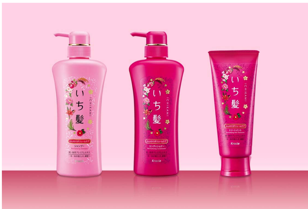
左からシャンプー、コンディショナー、トリートメント