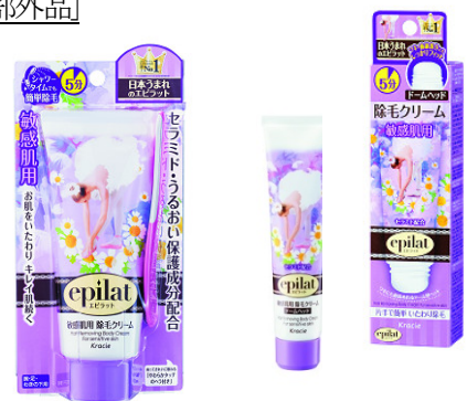
エピラット 除毛クリームキット(敏感肌用)左/ドームヘッド (敏感肌用)右