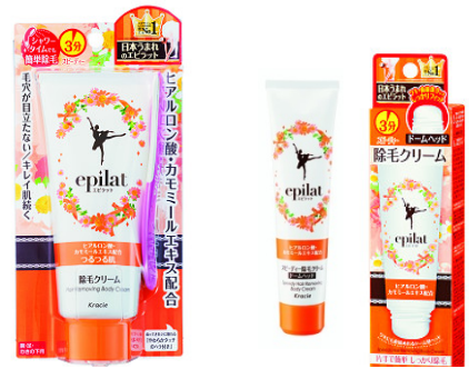
エピラット 除毛クリームキット(スピーディー)左/ドームヘッド (スピーディー)右