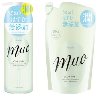
ミュオ ボディソープ ポンプ (480mL) 詰替用 (380mL)