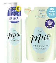
ミュオ クレンジングリキッド 本体 (170mL) 詰替用 (150mL)