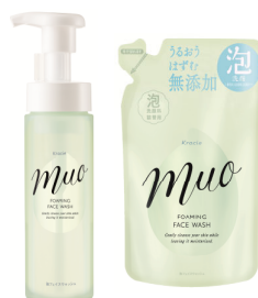
ミュオ 泡の洗顔料 本体 (200mL) 詰替用 (180mL)