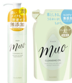
ミュオ クレンジングオイル 本体 (170mL) 詰替用 (150mL)