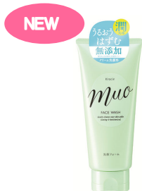
ミュオ クリーム洗顔料 120g