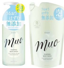
ミュオ 泡のボディソープ ポンプ (480mL) 詰替用 (380mL)