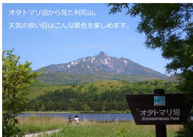
オタマリ沼から見た利尻山。 天気の良い日はこんな景色を楽しめます。

日本百名山に選ばれた利尻山（利尻富士）が頂上までくっきりとその姿を現すのは意外と確率が低いのです！？晴れていても頂上付近に雲がかかっていたりします。オタマリ沼という立地を活かし、事前予告した期間中、利尻山が頂上まで見えた回数に応じて割引率が変動するセールなどSNSと連動したセールも企画予定です！