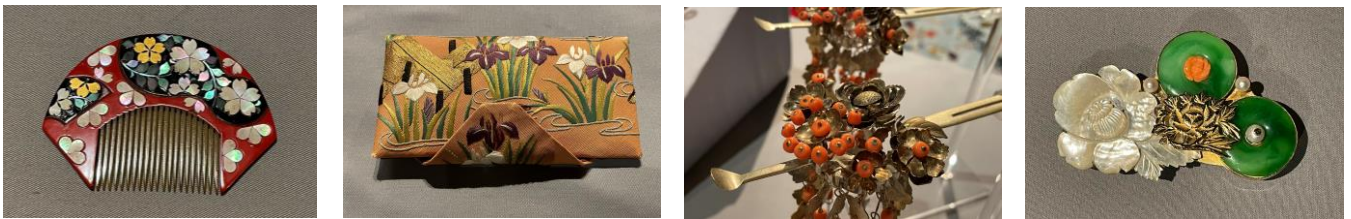
所蔵：澤乃井柳かんざし美術館

華やかに美しく女性の装いを彩ってきた、約 80 点の花をモチーフにした着物や装身具、化粧道具などを間近にご覧いただけます。文化が爛熟し、工芸技術が最も高い水準に達した江戸時代後期から昭和初期までの作品は、鼈甲（べっこう）や翡翠、金、銀、珊瑚などさまざまな素材が、螺鈿や蒔絵、透し彫りなど幅広い技法で仕上げられ、装飾工芸の技を凝縮した日本の粋が詰まっています。