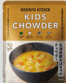
北海道産かぼちゃのチャウダー