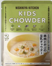
鶏肉とかぶの豆乳チャウダー