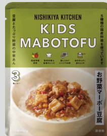
お野菜マーボー豆腐