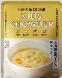
北海道産コーンのチャウダー