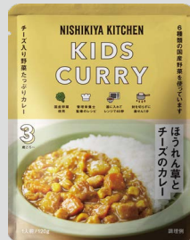
ほうれん草とチーズのカレー