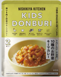
10種のお野菜キーマカレー