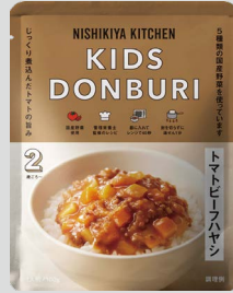
トマトビーフハヤシ