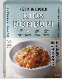
彩り野菜の肉みそあんかけ