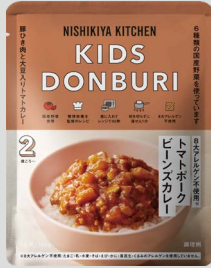
トマトポークビーンズカレー