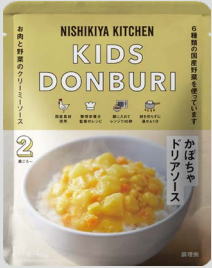
かぼちゃドリアソース