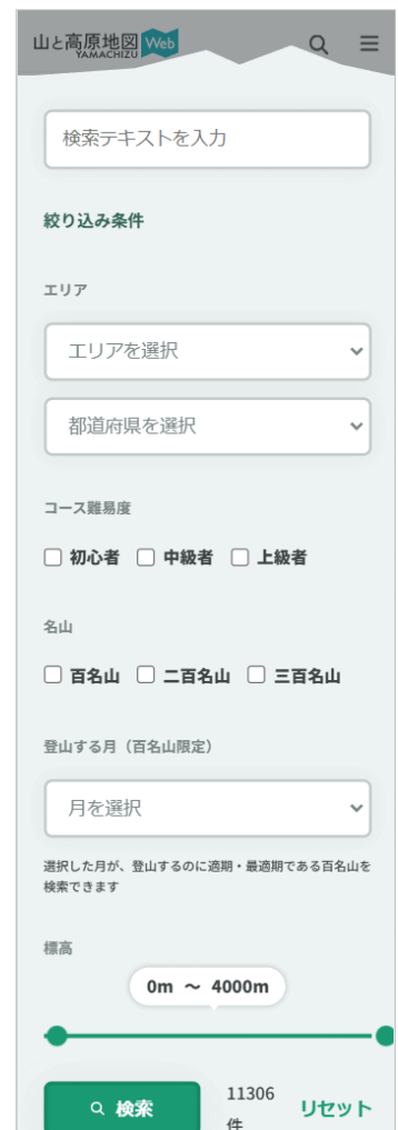
＜情報検索ページ例＞