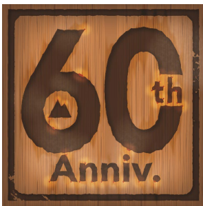
<山と高原地図 60 周年ロゴ>

～初心者の登山準備&山選び、中級者のステップアップを丁寧にアシストするサイトが誕生～