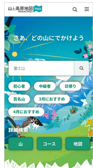
<サイト TOP 左：PC 版、右：携帯版>