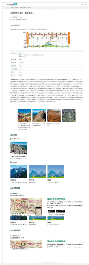
＜登山コース情報ページ例＞